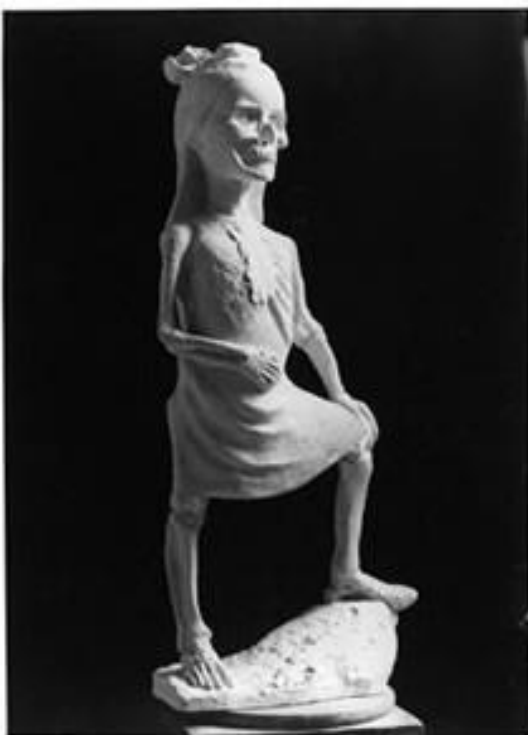
René Iché : Guernica , 1937, plâtre

Ses œuvres se trouvent dans une trentaine de musées dont le Centre Pompidou de Paris, l'Art institute de Chicago, et le MOMA de New-York.